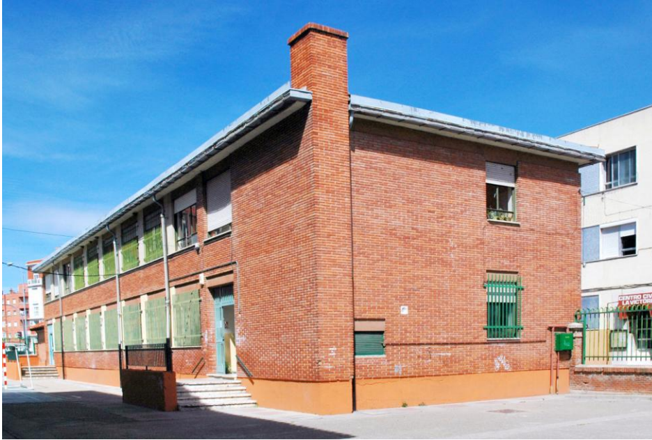
Edificio del Gimnasio, visto desde la Avda. de Burgos, en la actualidad Se pueden apreciar detrás el edificio del Centro Cívico y las modernas casas de la calle de La Victoria y plaza del Cosmos.