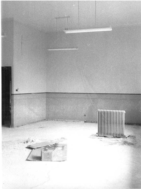
Foto del aula nueva que se creó en el pasillo de la planta baja del edificio Principal. La foto está hecha desde el interior del aula. Se puede apreciar que fue cuando se instaló el nuevo sistema de calefacción