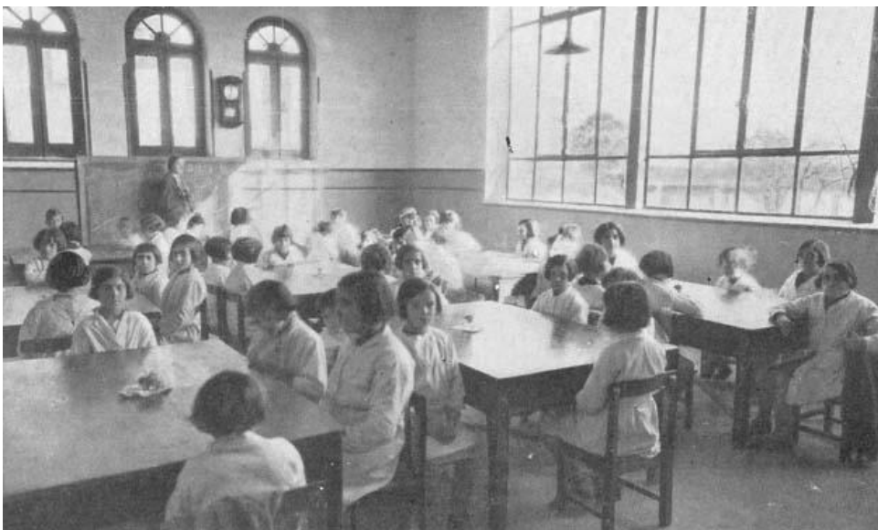
Aula de niñas del Grupo Escolar Pablo Iglesias. Se corresponde con el aula que está en la esquina que da al cuartel de la Policía Municipal (Avda. de Burgos).