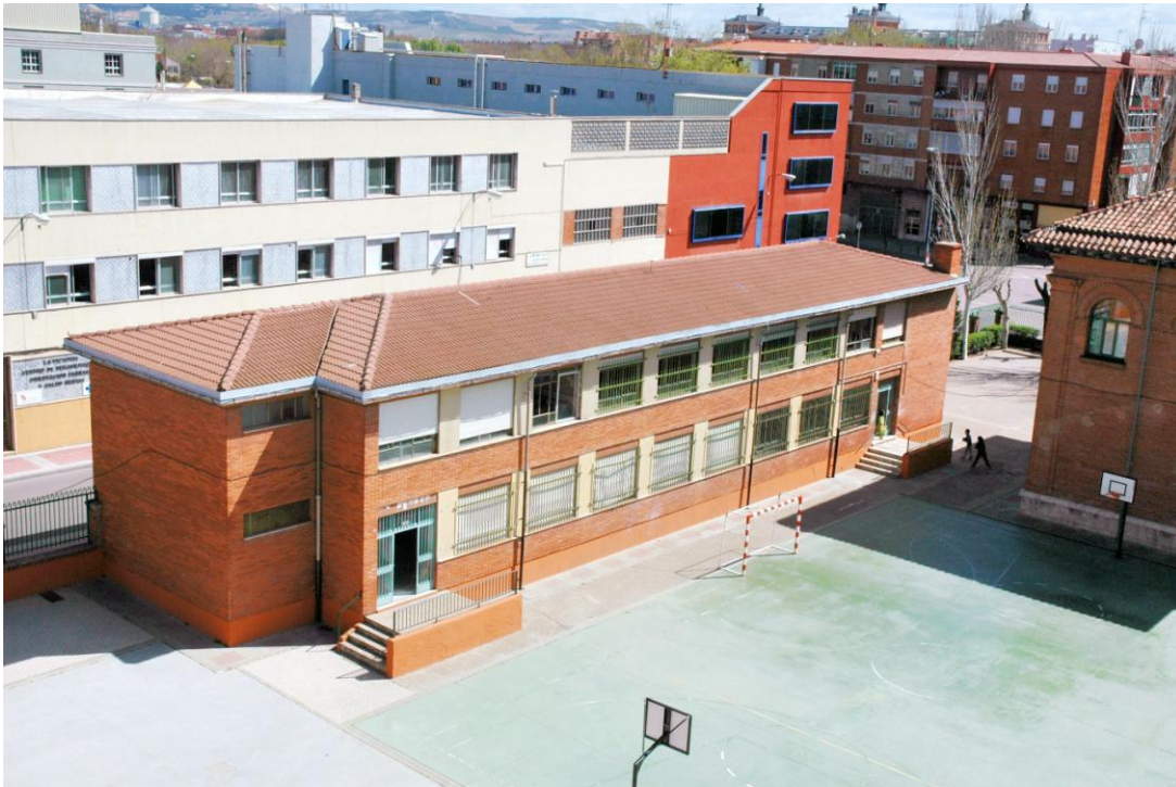
El edificio del Gimnasio en la actualidad. Detrás se pueden ver El Centro Cívico y El Cuartel de la Policía Municipal. Foto hecha desde la calle de La Victoria