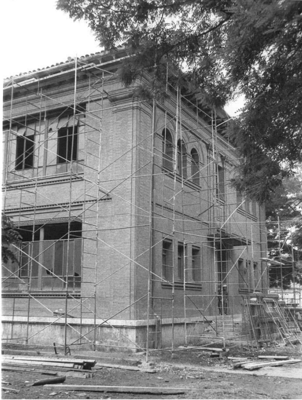
Remodelación del edificio de Ed. Infantil en la época correspondiente a la denominación de “Gonzalo de Córdoba”. La foto está tomada desde la Avda. de Burgos