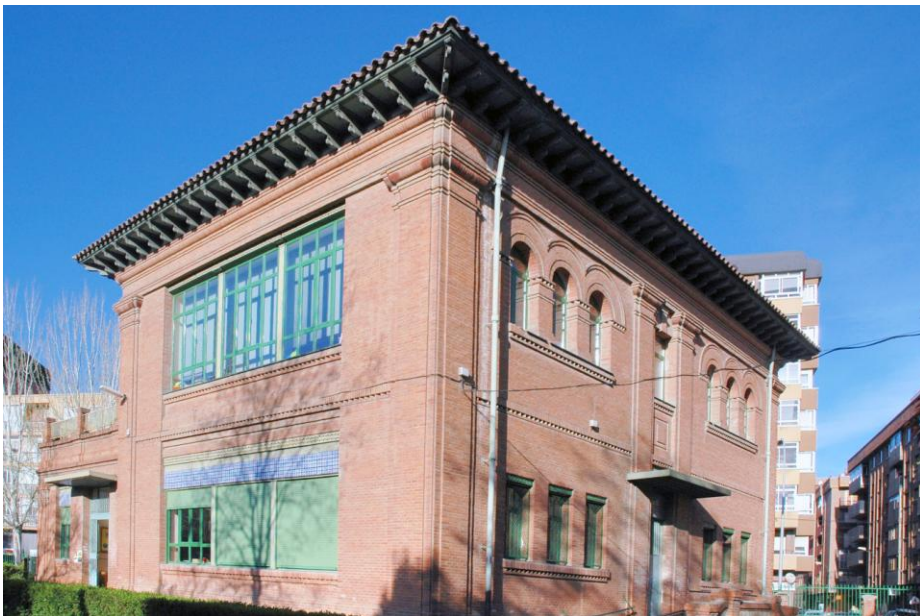
Edificio de Ed. Infantil en la actualidad. Como se puede ver, luce majestuoso. La foto está tomada desde la Avda. de Burgos. Es de destacar lo bonito la madera del alero del tejado