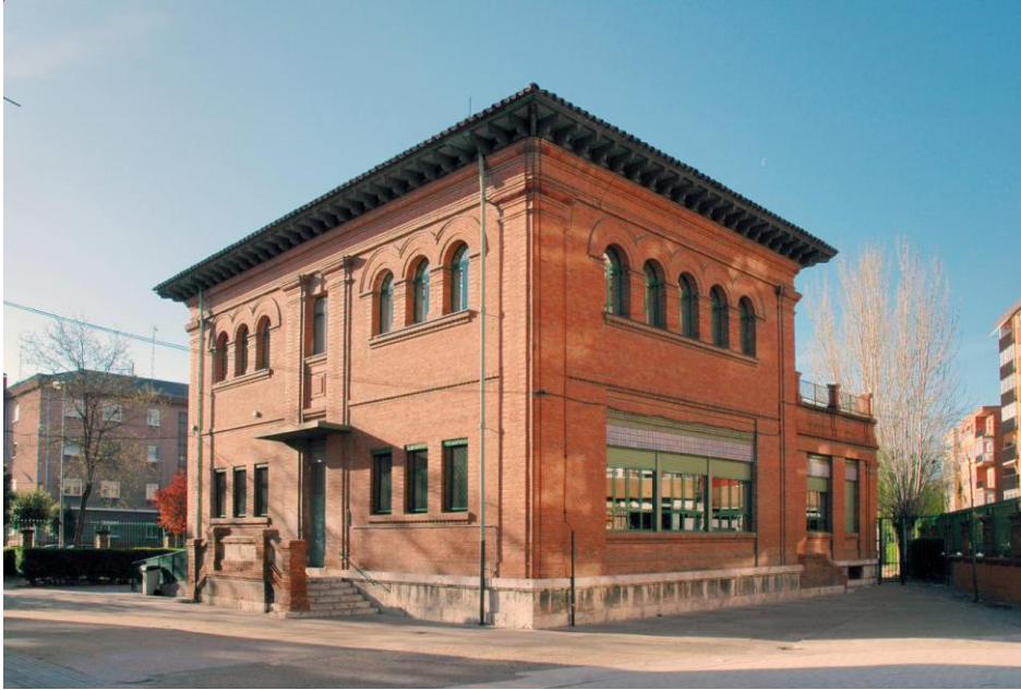
Edificio de Ed. Infantil en la actualidad, visto desde la calle de La Victoria. Luce precioso desde cualquier punto de vista.