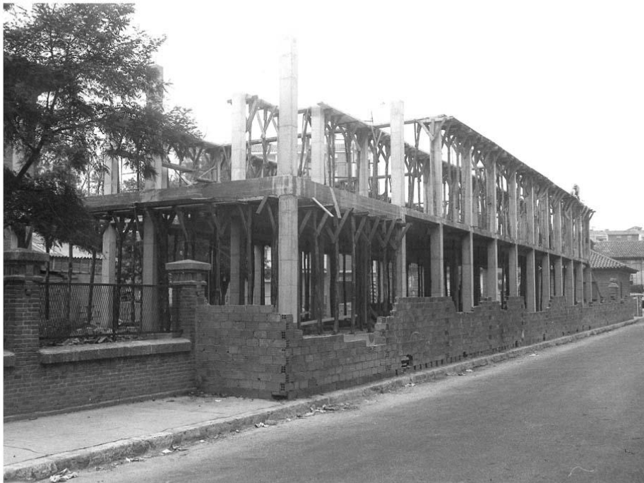
Armazón de la Construcción del edificio del Gimnasio, visto desde la calle de San Sebastián. Al fondo la antigua casa de la Portera.