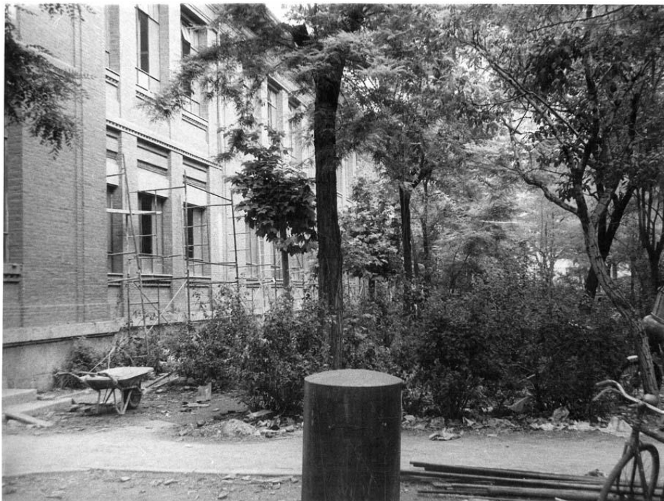
Remodelación del edificio Principal con la denominación de la época de "Gonzalo de Córdoba". La vegetación era muy abundante. Corresponde a la entrada por la Avda. de Burgos.