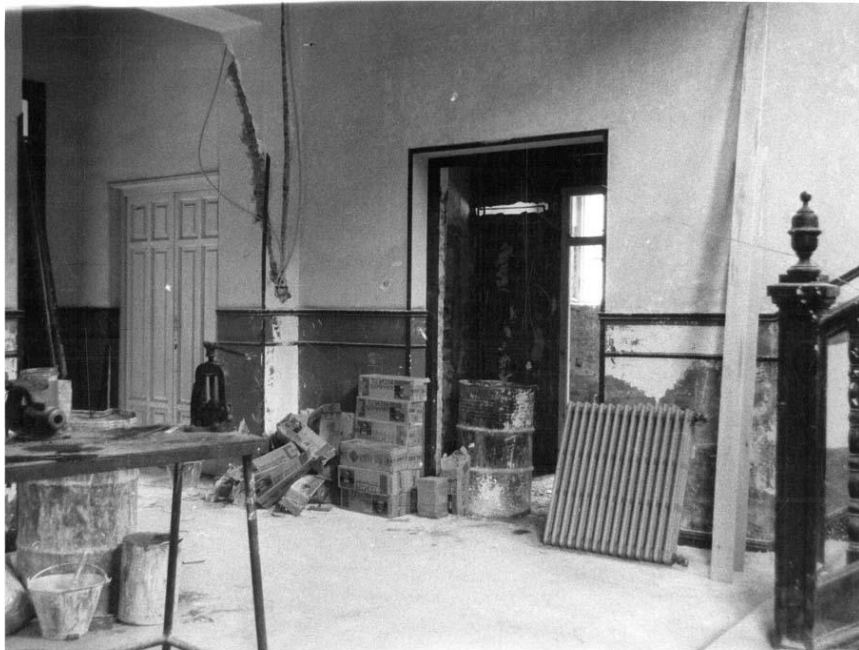
Remodelación del interior del edificio Principal. La foto corresponde al vestíbulo de la Dirección. Se aprecia la escalera, los servicios, la sala de Profesores y la entrada al edificio