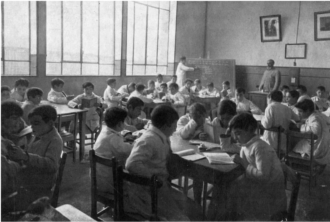
Aula de niños del Grupo Escolar Pablo Iglesias. Se corresponde con el aula que está junto a la Dirección (mirando hacia la Avda. de Burgos).