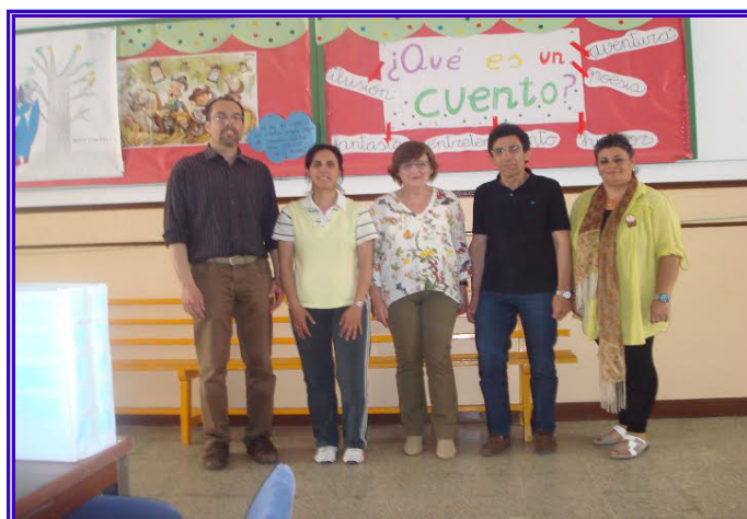
Foto entrega de la donación