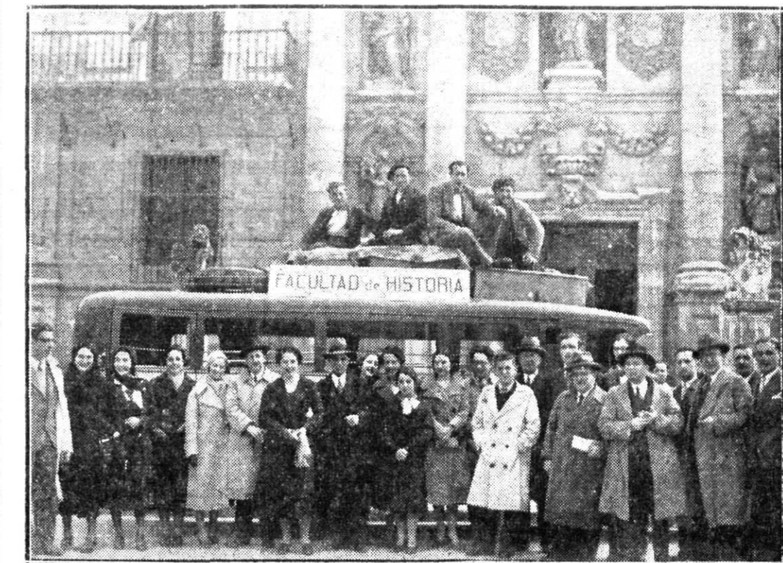
Salida de los alumnos de la Facultad de Historia de nuestra Universidad, en su excursión por Andalucía